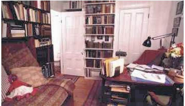
Lo studio della Yourcenar

Con quella "patria" sempre presente, Marguerite Yourcenar è la prima donna ad essere eletta all'Académie Française.