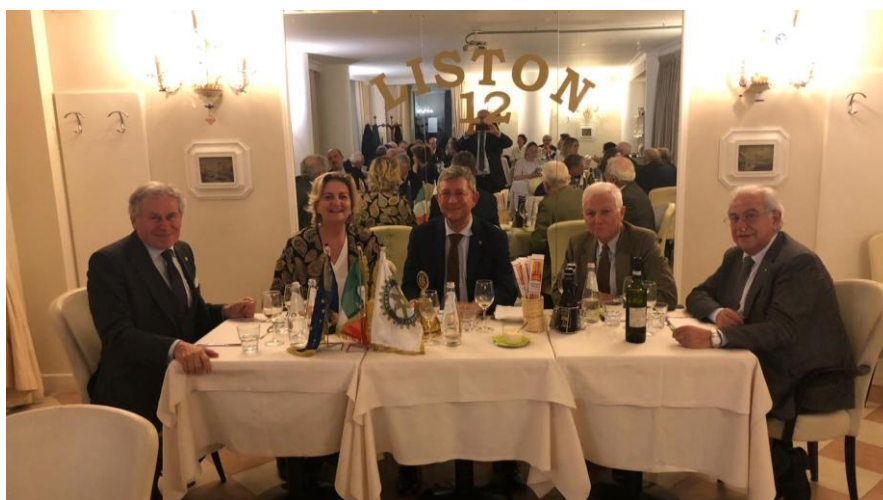
Il tavolo della Presidenza: