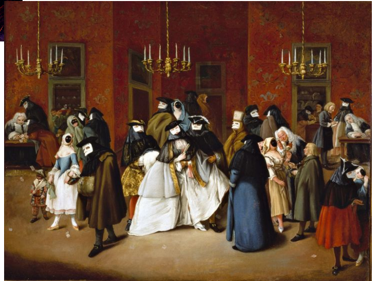
Pietro Longhi, "Il Ridotto" (1740)