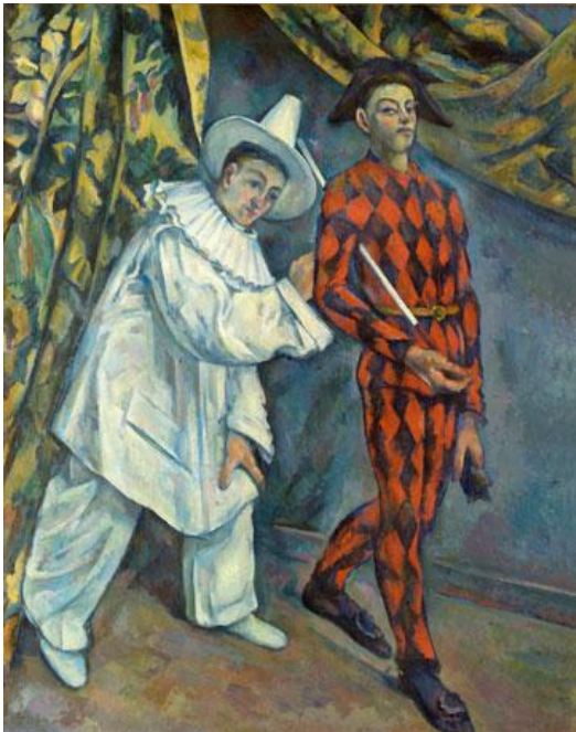
Paul Cézanne, "Arlecchino e Pierrot" (1888)