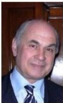
Il procuratore Carlo Nordio